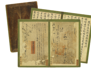
壬乱捷報書目 宝物 | 崔希亮(1560~1651) | 1598年 朝鮮