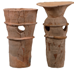
円筒形土器 光州月桂洞1号墳 | 三国