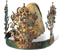
金銅冠 国宝 | 羅州新村里9号墳 | 三国

展示室は、<甕棺室>と<古墳遺物室>からなっています。<甕棺室>は、甕棺室、羅州伏岩里3号墳室、新村里9号墳金銅冠室に分かれています。甕棺室では、時期ごとの変遷がわかる約80点の大型甕棺を展示しています。壁面では、'永遠の安息'をテーマにしたメディアアート作品が上映されており、甕棺と映像を一緒に鑑賞することができます。羅州伏岩里3号墳室では、百済の影響下における甕棺の変遷の様子を紹介しています。新村里9号墳金銅冠室では、金銅冠が出土した甕棺と一緒に展示されており、臨場感のある形で甕棺に触れることができます。<古墳遺物室>では、古墳から出土した鉄器・玉・土器などのさまざまな副葬品とともに、副葬品を通じた外部との交流の様相を紹介しています。