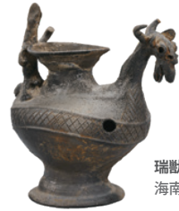
瑞獣形土器 海南万義塚1号墳 | 三国