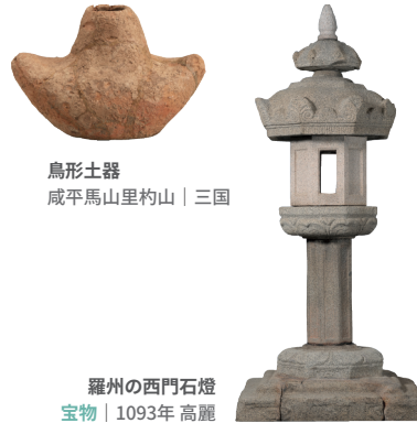
鳥形土器 咸平馬山里約山 | 三国