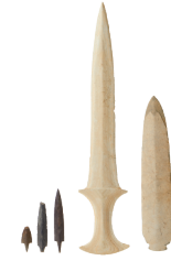
磨製石剣と石鏃 咸平徳林里白羊支石墓 | 青銅器